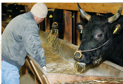
▲羽後牛は誇りと愛情を注ぎ込み、並々ならぬ こだわりを持って飼育されています。

可能な限り添加物を与えず天然飼料で飼育することができるため、人体にも安全、かつ品質の良い黒毛和牛を育てることが可能になりました。「農畜循環」は、米どころ秋田県南部でも山際に位置する羽後町ならではの人体にも環境にも優しい農畜産法なのです。